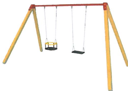
1 huśtawka podwójna, drewniana z krzeselkiem dla najmłodszych