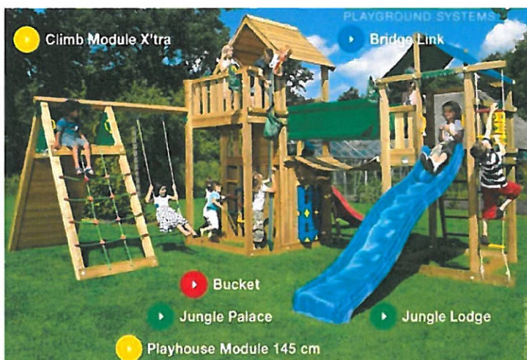
Zestaw zabawowy, drewniany